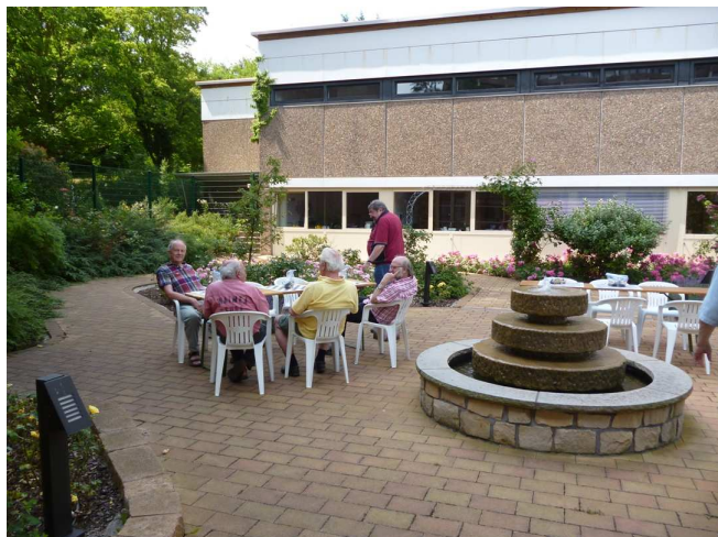
Der Innenhof – gleich neben dem Turniersaal – lädt zum Verweilen ein

Nähere Informationen erhalten Sie auch von der Tourist Information Neustadt an der Weinstraße Tel.: 06321/926892 • www.neustadt.eu