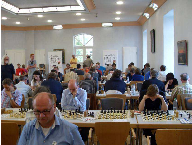
Volles Haus im Schloss Ardeck

Nachdem bereits einige Tage vor dem Turnier die maximale Teilnehmerzahl von 150 erreicht war, hat man das Schloss Ardeck in Gau-Algesheim noch mal genau vermessen und schließlich Platz für alle 163 Spielerinnen und Spieler gefunden.