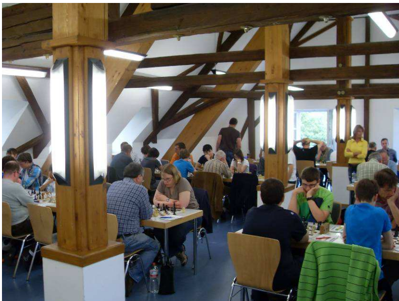
Der 2. Spielsaal „Säulensaal“